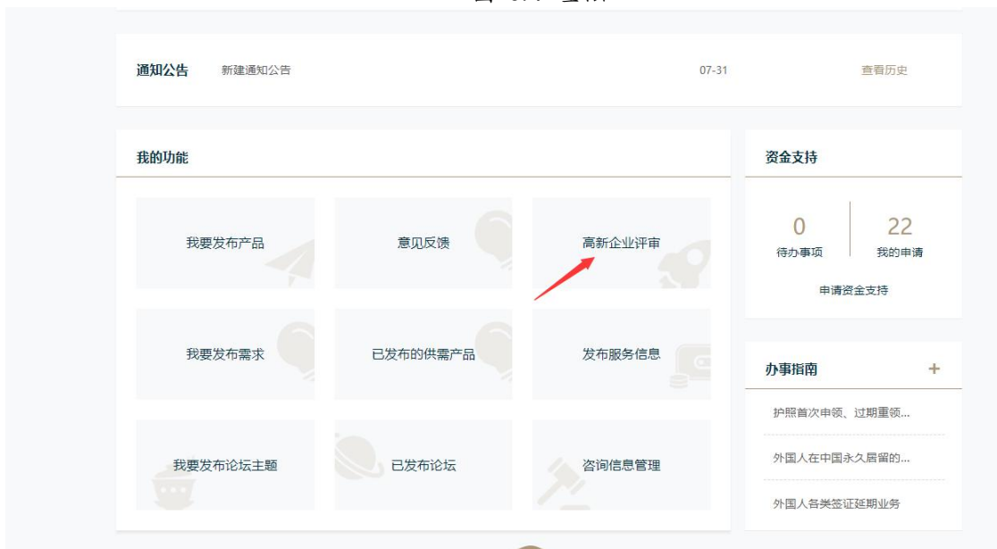
图 3.10 企业空间