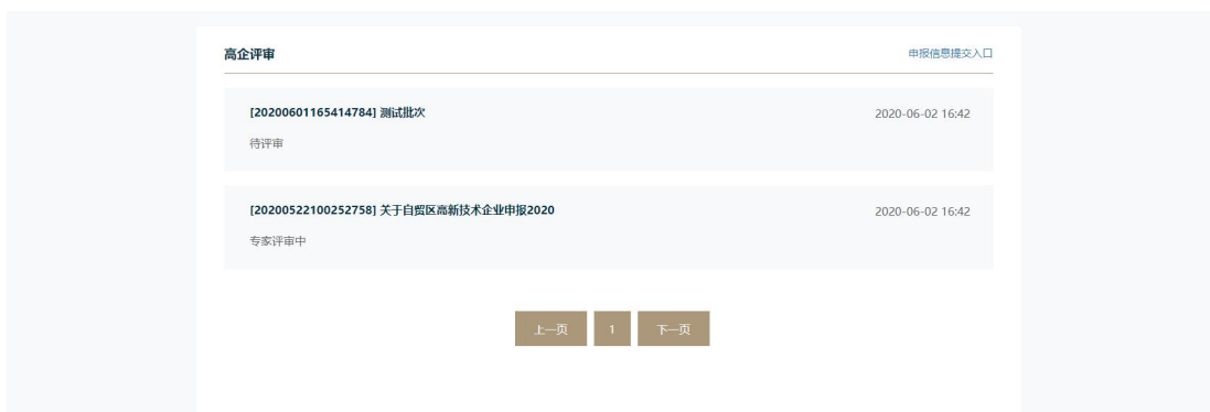
图 3.15 申报列表