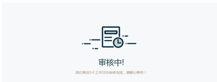
图 3.6 认证审核中界面