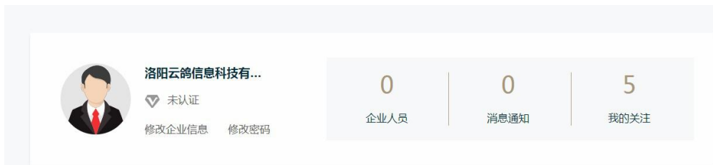
图 3.3 未认证企业显示状态

进入企业空间首页后，页面会展示当前企业的认证状态，如图 3.3 所示。未认证的企业点击【未认证】可进入企业认证类型选择界面，如图 3.4 所示。