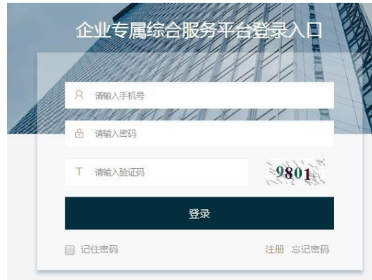
图 3.2 登录页