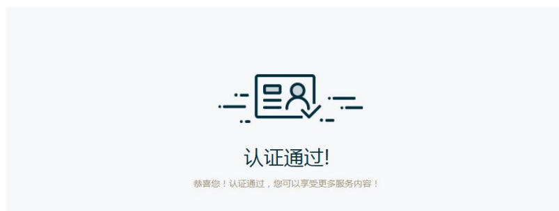
图 3.7 认证通过