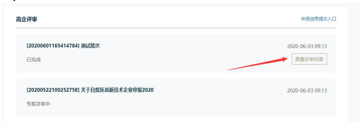
图 3.16 评审结果