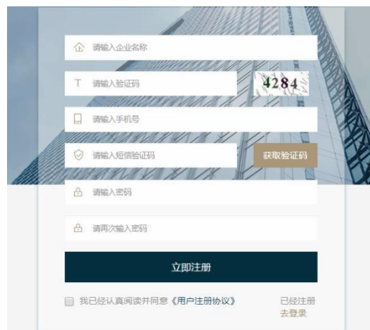
图 3.1 注册界面

点击企业专属综合服务平台首页中间位置【立即注册】按钮即可进入注册界面，如图 3.1 所示。（在登录页面点击【注册】按钮也可跳转至注册页）用户输入企业名称、图片验证码、手机号、短信验证码、密码、确认密码。点击【获取验证码】，填写的手机号会收到系统发送的短信验证码。所有信息填写正确后点击【立即注册】，注册成功后页面会跳转至登录页。