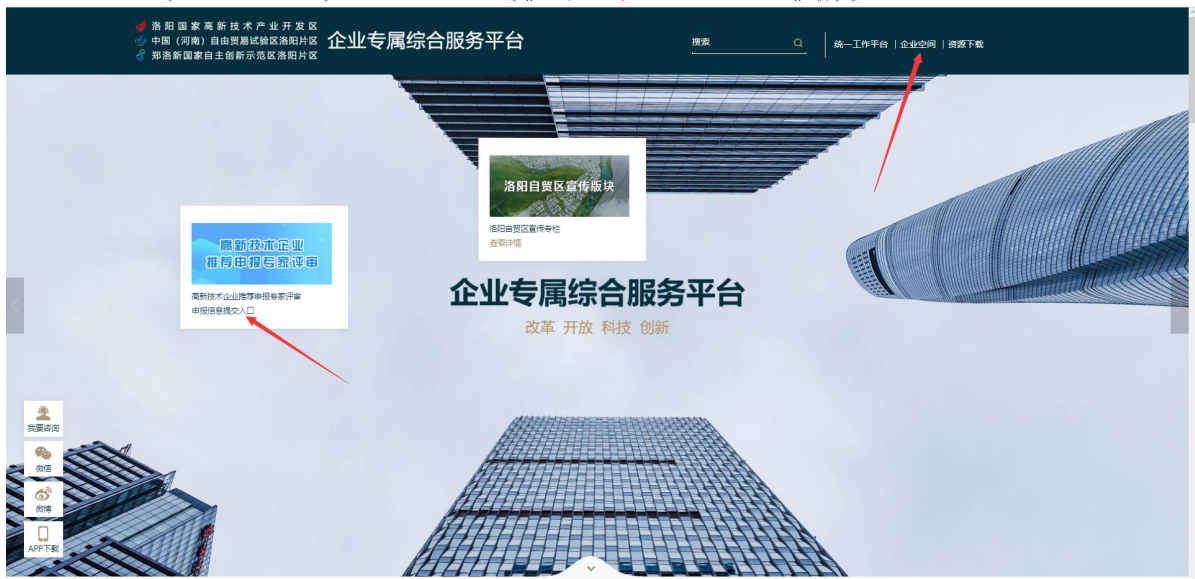
图 3.8 企业专属服务平台