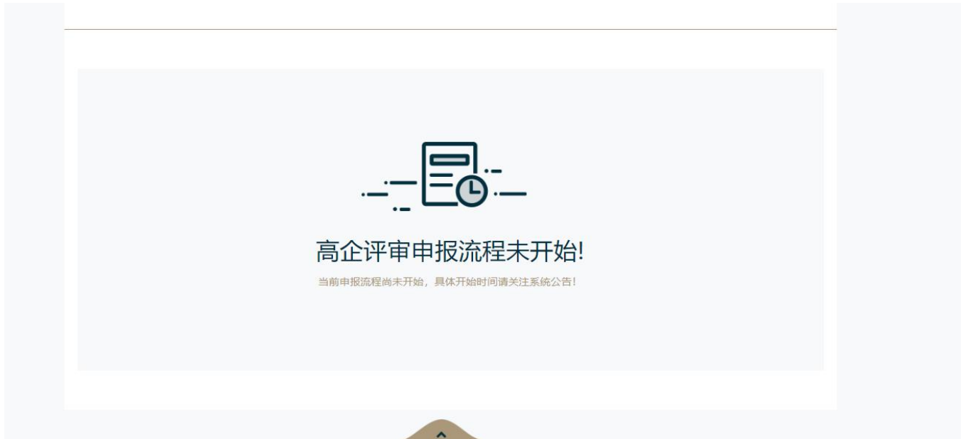
图 3.11 申报流程未开始

点击【高新企业评审】,如果当前时间节点没有申报批次,会出现‘高企评审申报流程未开始’提示信息,关注系统公告查看具体开始时间,如图 3.11所示。