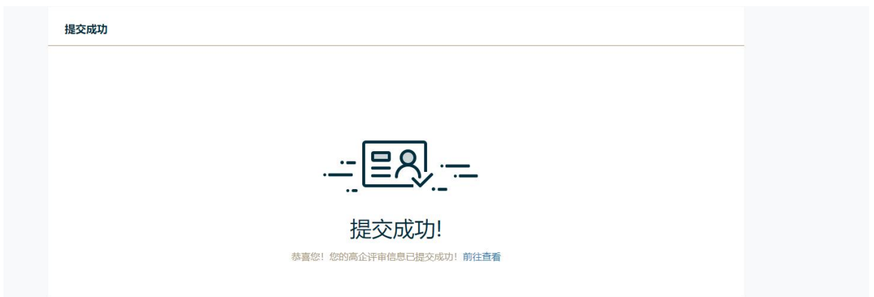
图 3.14 提交成功

提交成功后点击确认, 页面显示“提交成功!”显示文字, 点击【前往查看】, 可查看申报列表, 和当前申报所处的状态. 如图 3.14, 图3.15.