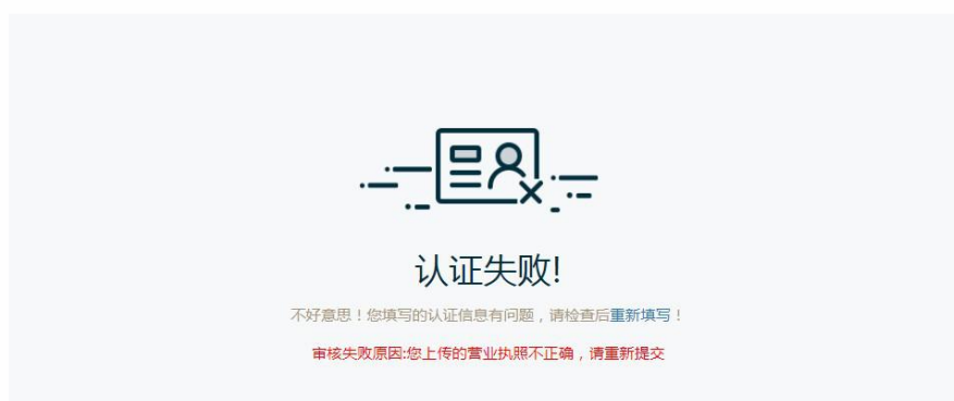
图 3.8 认证失败

认证失败的页面会显示“认证失败！”提示文字，并显示审核失败原因，点击【重新 填写】可重新填写认证信息后再次提交认证，如图 3.8 所示。