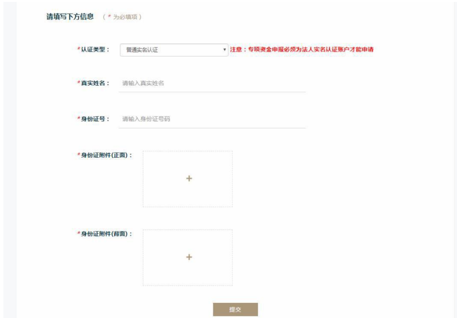
图 3.5 认证资料填写界面

鼠标移动至认证类型模块，点击【去认证】按钮，页面进实名认证信息填写界面，如图 3.5 所示（本图展示的是个人实名认证资料填写页）。资料填写完整后，点击【提交】按钮即可提交实名认证。注：提交的图片大小不能超过 1M。