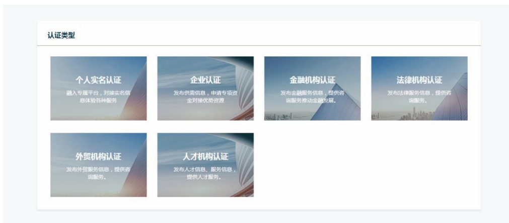
图 3.4 企业认证类型界面